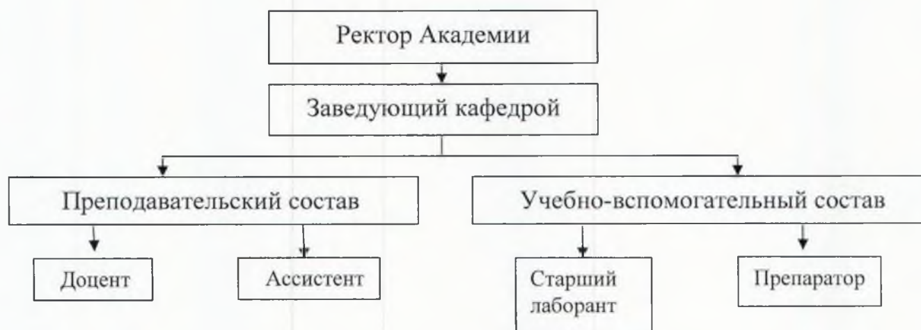
Схема организационной структуры кафедры детской хирургии