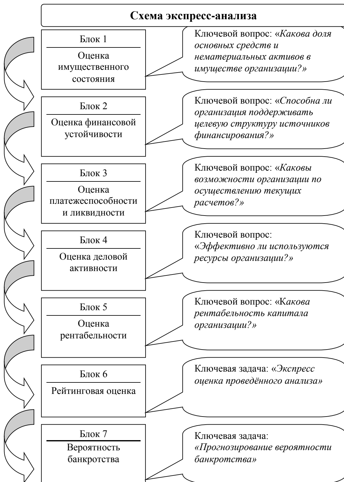
Рис. 1 Схема экспресс-анализа финансово-хозяйственной деятельности