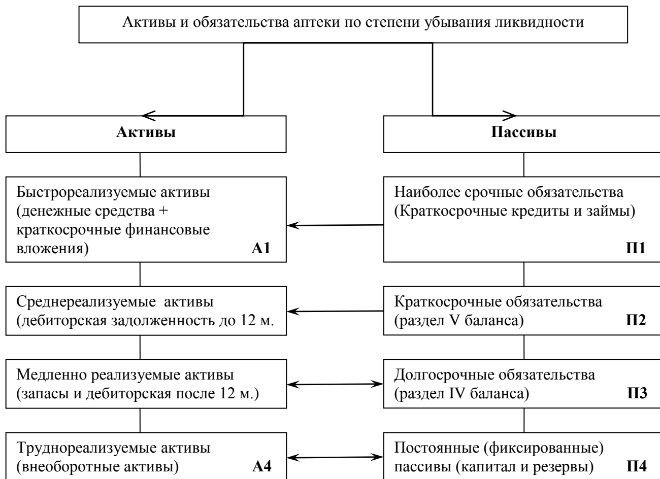
Рис. 7. Классификация активов и пассивов по степени убывания ликвидности

Для осуществления анализа активы и пассивы баланса классифицируют по степени убывания ликвидности (рис. 7).